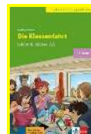
Níveis A e B