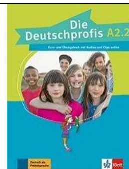
Níveis A, B e C

Obs.: Adquira os livros solicitados para Língua Alemã SOMENTE após a confirmação do nível que o aluno frequentará, a ser feita durante a primeira semana de aula.