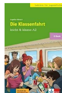
Níveis DSD e A