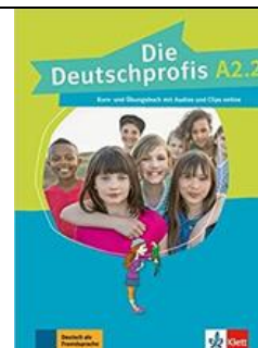
Níveis A, B e C

Obs.: Adquira os livros solicitados para Língua Alemã SOMENTE após a confirmação do nível que o aluno frequentará, a ser feita durante a primeira semana de aula.